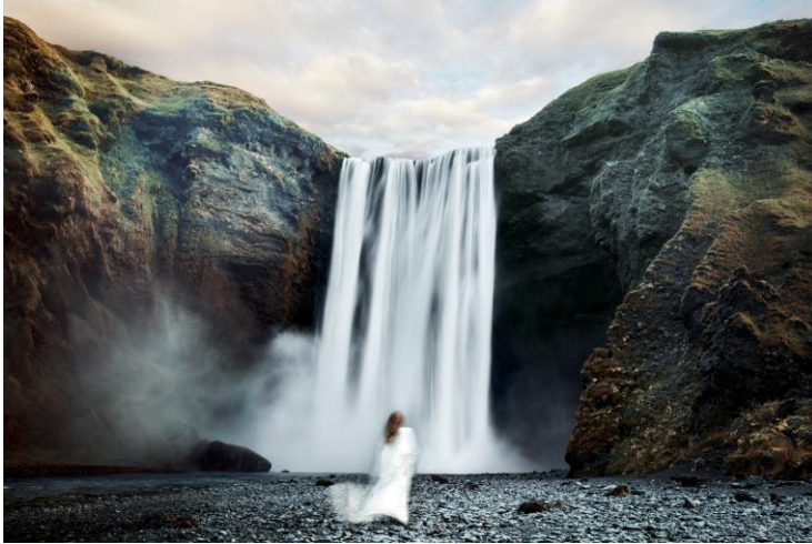
Bild 1: Nichts ist so lebendig wie weißes, natürliches Licht. TunableWhite folgt seiner Dynamik und bedient sich dessen emotionaler Qualität.