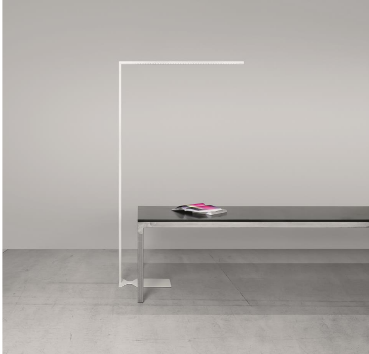
Bild 3: LINETIK stellt alle klassischen Prinzipien der Bürobeleuchtung in Frage – integriert sich aber dennoch perfekt in jede Bürolandschaft.