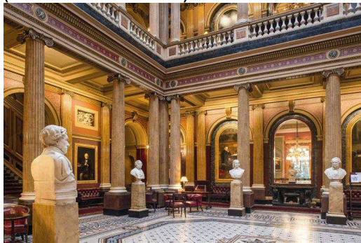
Bild 1: Die Lichtlösung sollte das Charisma des historischen Baus hervorheben und bei den Gästen und Mitarbeitern für eine angenehme und unvergessliche Atmosphäre sorgen, während gleichzeitig konservatorische und energetische Anforderungen erfüllt werden.