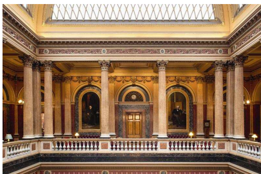
Bild 3: Die Basis für diese nachhaltige Lichtlösung bildet das perfekte Zusammenspiel moderner LED-Technologie mit innovativen Leuchten und einem intelligenten Lichtmanagement als Herzstück: Das Zumtobel Lichtmanagementsystem Luxmate Litenet vereint komplexe Systemeigenschaften wie Tageslichtnutzung, Anwesenheitssensorik, Integration von Notlicht und vordefinierte Raumprofile zu einer zentralen und leicht bedienbaren Einheit.