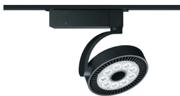
Faretto LED DISCUS evolution