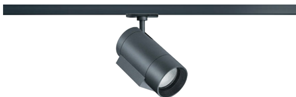
ARCOS 2 xpert LED | 22 W