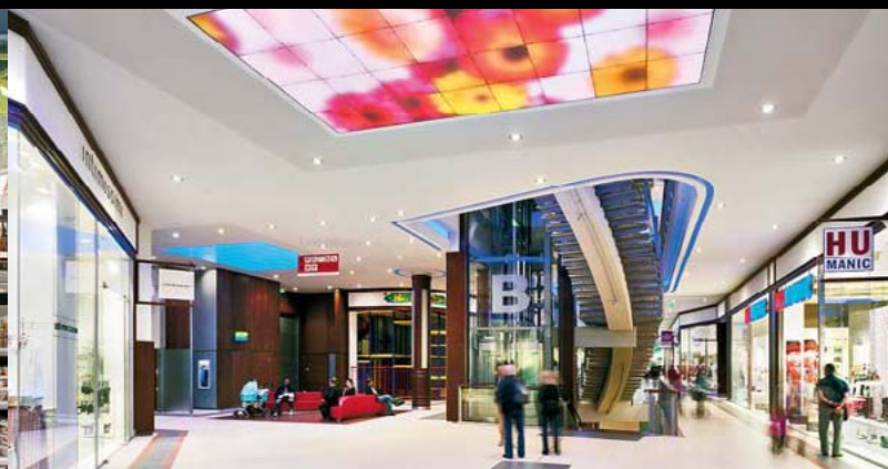
STADION CENTER WIEN / A

Architect: SVT Branding & Design Group, Amsterdam / NL