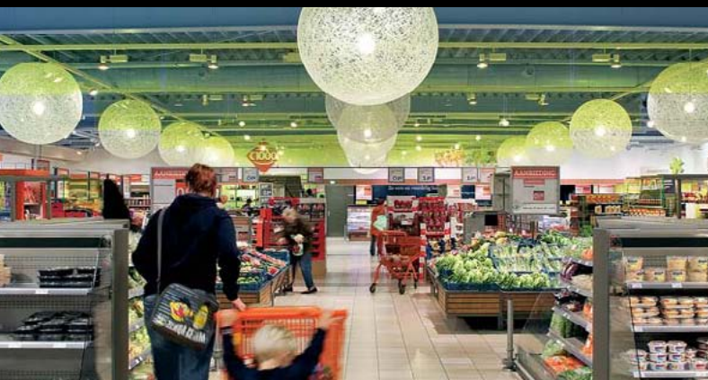
SUPERMARKT C1000*, NUENEN / NL

Architect: Atelier EIS, Ceske Budejovice / CZ