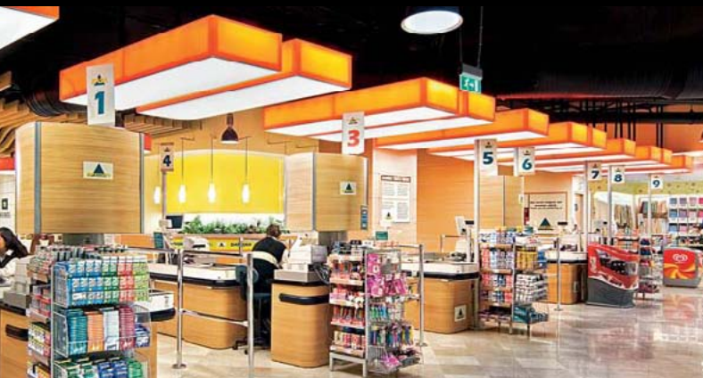
Macrocenter, Istanbul / TR

Architect: Projects International Japan Inc., Tokio / JP Lightingdesigner: Koizumi Lighting Technology Corp. Tokio / JP