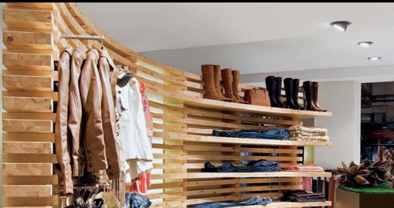
MANGOLD, ULM / D

Lightingdesigner: Sonepar Deutschland/Region West, Holzwickede / D