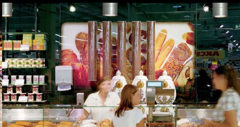
Interspar Budweis / CZ

Architect: MuuM Architects, Istanbul / TR Lightingdesigner: KROMA, Istanbul / TR