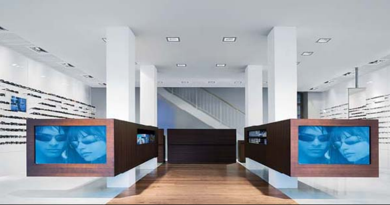
BURRIOPTIK, ZÜRICH / CH

Architect: Rolf Nimmrichter, Arch. ETH SIA, Zürich / CH