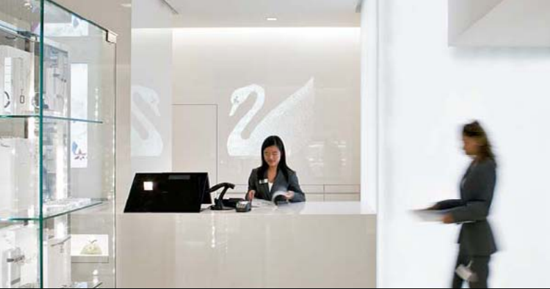
SWAROVSKI, LONDON / UK

Architect: Rolf Nimmrichter, Arch. ETH SIA, Zürich / CH