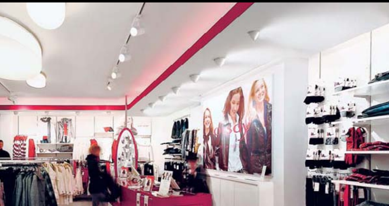
ORSAY BOUTIQUE, MÜNCHEN / D

Concept: Tokujin Yoshioka Design, Tokyo / JP