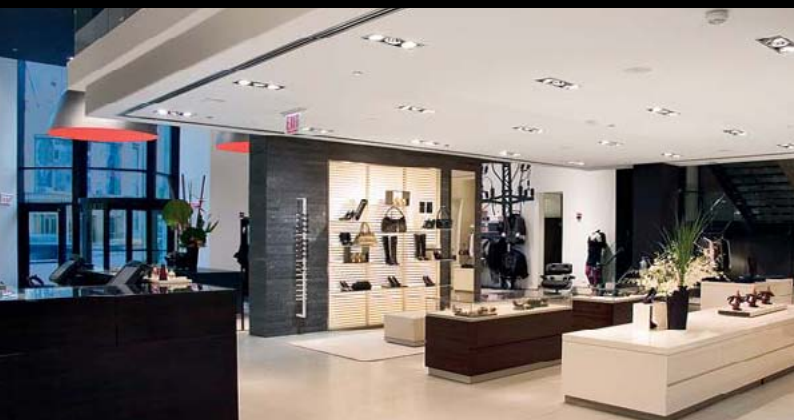
BOSS MAN SHOP, RICHMOND, VIRGINIA / USA

Architect: Concept – CDPlan, Goldenstedt / D