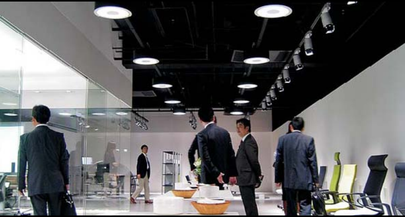
Showroom Wilkhahn, Tokio / JP

Architect: Architekturbüro Preuß, Münster / D