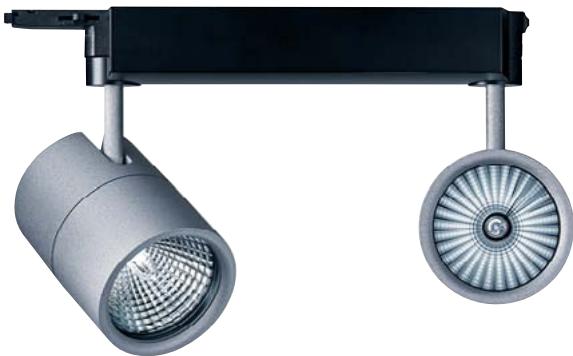
VIVO | SPOTLIGHTSYSTEM / STRAHLERSYSTEM | Design by EOOS

The VIVO series of spotlights, which come in three different design sizes, are bound to impress with their almost cylindrical shape. A ball-and-socket joint allows exceptional mobility in every direction. Various light sources are available, ranging from discharge lamps to LEDs.