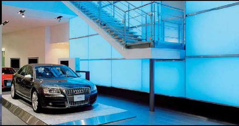
Audi Forum, Tokio / JP

Architect: Noiz/architecture, design & planning, Tokio / JP Hironobu Kira, Koizumi Lighting Technology Corp., LCR.,Tokio / JP