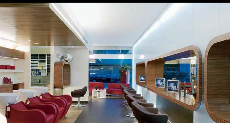
Friseur Egger, Lustenau / A