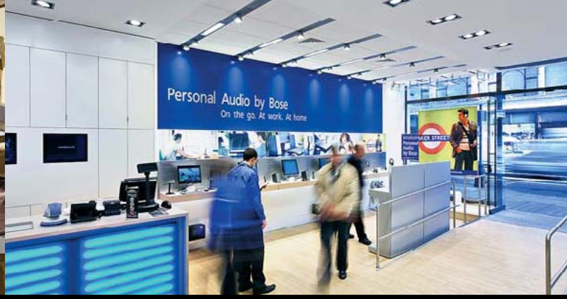
BOSE FLAGSHIP-STORE, LONDON / UK

Architect: Architekturbüro Preuß, Münster / D