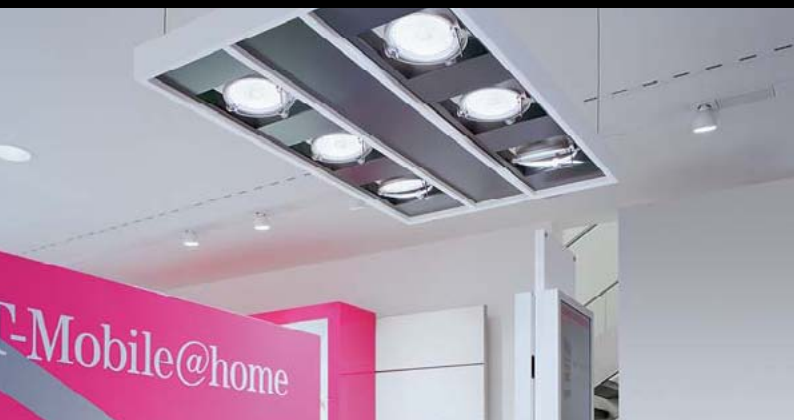
T-MOBILE, BONN / D

Architect: Concept – CDPlan, Goldenstedt / D