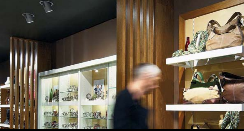
FOSSIL, KÖLN / D