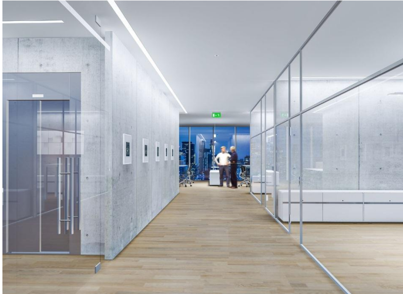
Foto 2: De uitgebreide SLOTLIGHT infinity uitvoering biedt een ondoorzichtige optiek en wordt geleverd met een afdekking die tot 20 meter aan een stuk kan doorlopen.