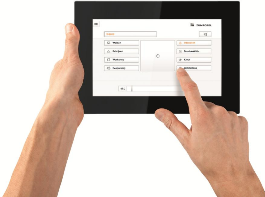
Foto 1: Een onafhankelijke tijdstudie van REFA-Consulting toont dat de inbedrijfstelling van een lichtsturing met LITECOM duidelijk sneller gebeurt dan met een vergelijkbaar KNX-systeem.