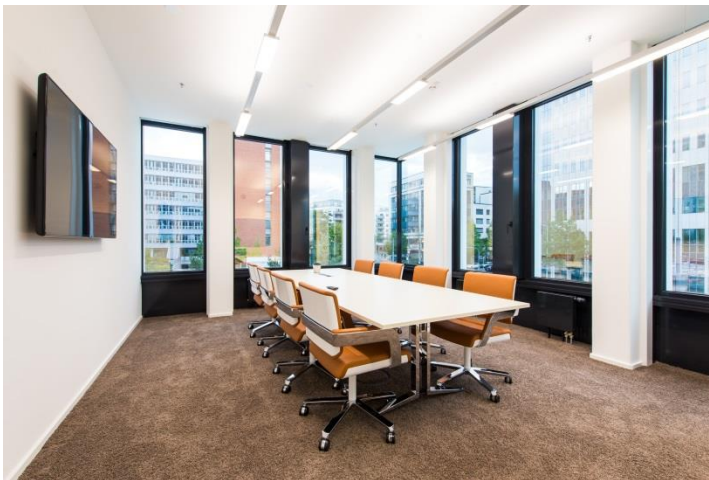
Image 4 : Tout aussi important que l'efficacité énergétique : cette tâche est prise en charge par le système de gestion de l'éclairage LUXMATE LITENET à l'aide du détecteur de présence incorporé de manière pratiquement invisible dans le rail porteur et de l'héliomètre installé sur le toit.