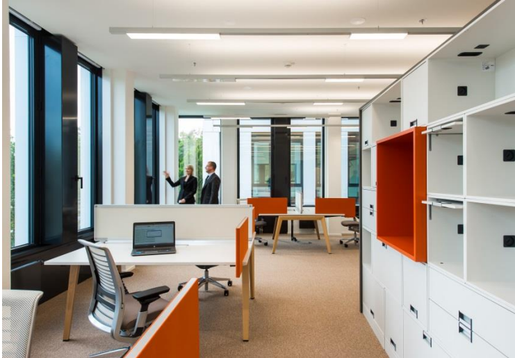
Image 3 : SEQUENCE track permet d'installer trois ou cinq modules LED ultra-plats de seulement 25 mm de haut sur des rails porteurs suspendus en fonction des besoins.