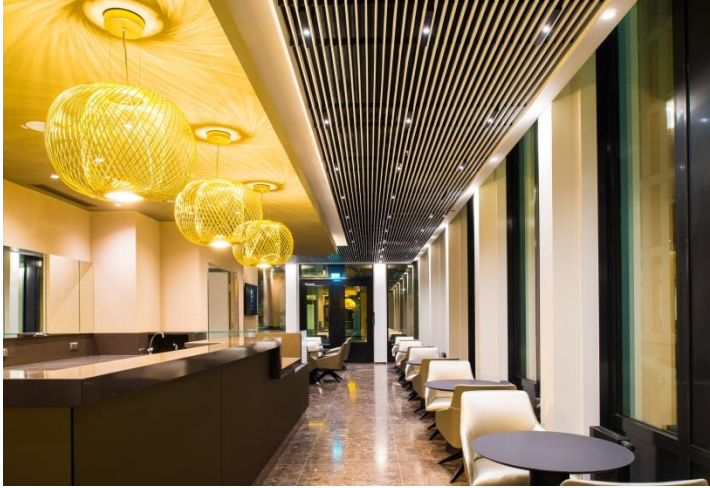
Foto 5: Gli interni del moderno reparto gastronomico fanno pensare più alla lounge di un hotel che a una classica mensa.