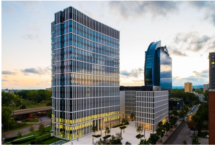
Foto 1: A Francoforte il grattacielo St. Martin Tower, formato da una torre a forma di ala affiancata a un altro edificio a ferro di cavallo (West Wing), dà il via a una nuova era delle architetture di uffici.