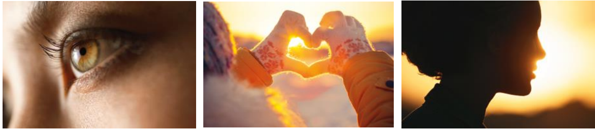
Foto 2: Active Light ondersteunt de mens op drie niveaus – visueel, emotioneel en biologisch.