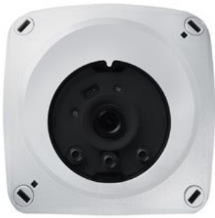
Foto 5: De contrastsensor ATIVO integreert het beschikbare daglicht, houdt het gedefinieerde lichtniveau constant en detecteert bewegende objecten. Het grootste pluspunt vormt de nagenoeg vrije inrichting van rechthoekige detectiezones, tot vijf per sensor.