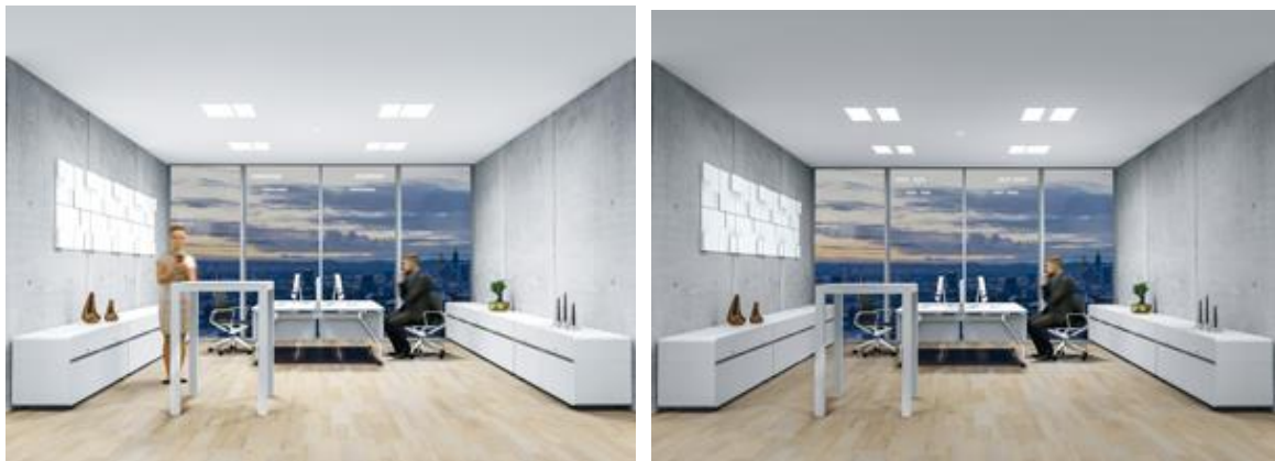
Foto 4: Active Light zorgt op het juiste moment voor licht met de juiste intensiteit en kleur. Daarbij staat het natuurlijke licht model en wordt het natuurlijke bioritme ondersteund, zoals aangegeven door de Human Centric Lighting filosofie.