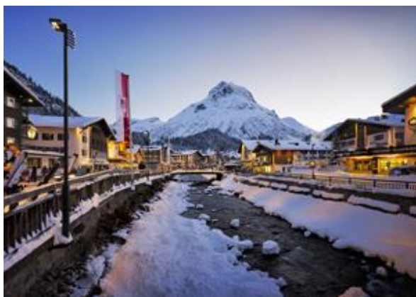
Foto 7: Met SUPERSYSTEM outdoor heeft Zumtobel een nieuwe LED-armatuurreeks ontwikkeld die voor een accentuerende, ruimtevormende LED-verlichting in buitenruimtes zorgt.

Foto 6: Met Active Light in combinatie met Limbic® Lighting kunnen in retailtoepassingen merken en producten voor hun doelgroepen optimaal worden geënsceerd.