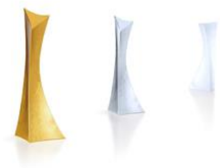
Foto 3: Met tunableWhite kunnen kleurtemperatuur en intensiteit traploos aan de tentoongestelde producten of kunstwerken worden aangepast en zo een optimale waarneming mogelijk te maken.