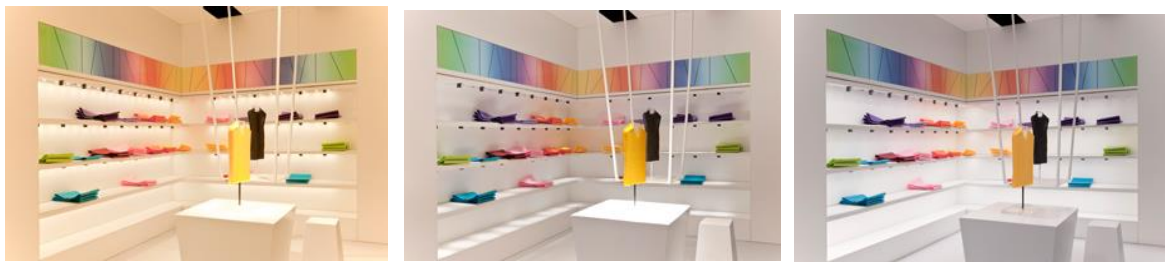
Foto 6: Met Active Light in combinatie met Limbic® Lighting kunnen in retailtoepassingen merken en producten voor hun doelgroepen optimaal worden geënsceerd.

Foto 5: De contrastsensor ATIVO integreert het beschikbare daglicht, houdt het gedefinieerde lichtniveau constant en detecteert bewegende objecten. Het grootste pluspunt vormt de nagenoeg vrije inrichting van rechthoekige detectiezones, tot vijf per sensor.