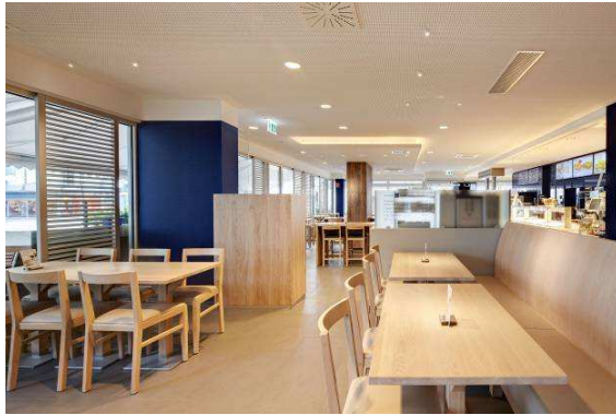
Bild 4: Der Gastraum mit einem warmweißen Lichtszenario zu Morgen- oder Abendstunden (Panos Infinity Tunable White).