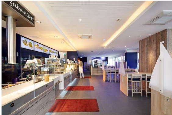
Bild 6: Der Gästebereich in einer kühlen, bläulichen Lichtstimmung (Panos Infinity Tunable White) – hinter der Theke hingegen eine konstante Beleuchtung mit hohen Beleuchtungsstärken (Panos Infinity Stable White).