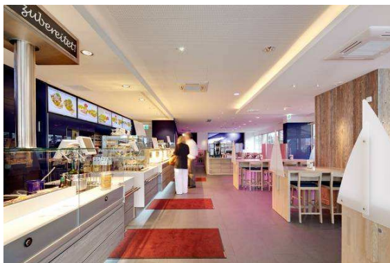
Bild 7: Der Gästebereich in einer warmen Lichtstimmung in Magenta (Panos Infinity Tunable White) – auch hier bleibt das Licht hinter der Theke mit der Beleuchtungsstärke beständig (Panos Infinity Stable White).