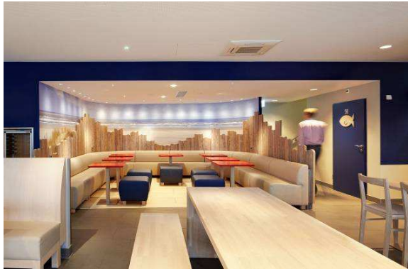
Bild 1: Die Lounge in warmweißem Licht – ähnlich dem der aufgehenden Sonne (Panos Infinity Tunable White).