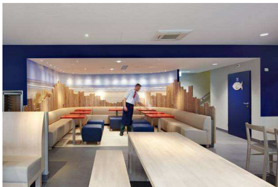
Bild 2: Strahlendes Tageslichtweiß in der Lounge mit einer kaltweißen Lichtstimmung (Panos Infinity Tunable White).