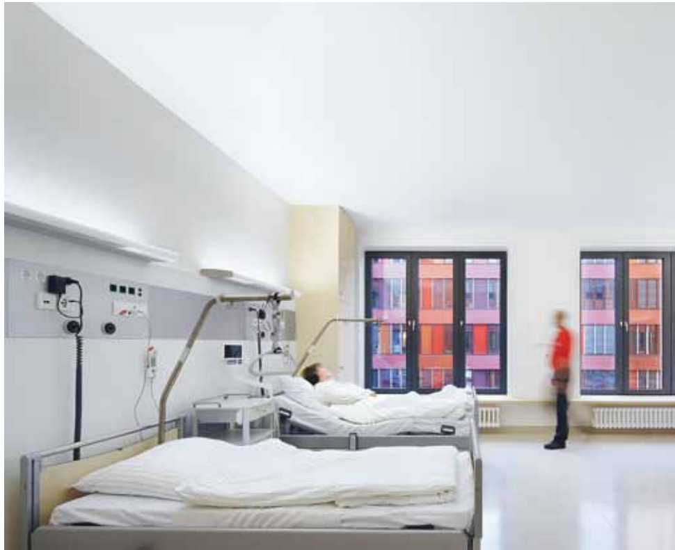
B2 | Zand- en aardetinten zorgen in de patiëntenkamers voor een bijna behaaglijke sfeer.