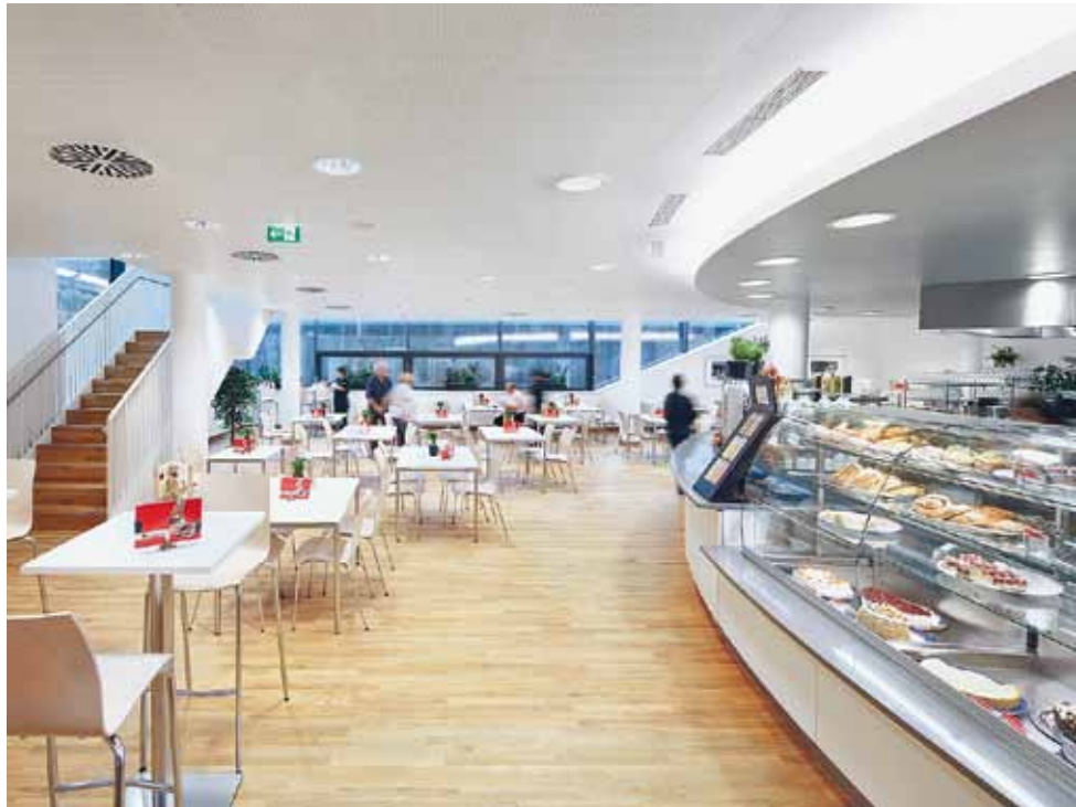
B4 | Bij de kliniek hoort ook een openbaar toegankelijk gedeelte met shopping centre en cafetaria.