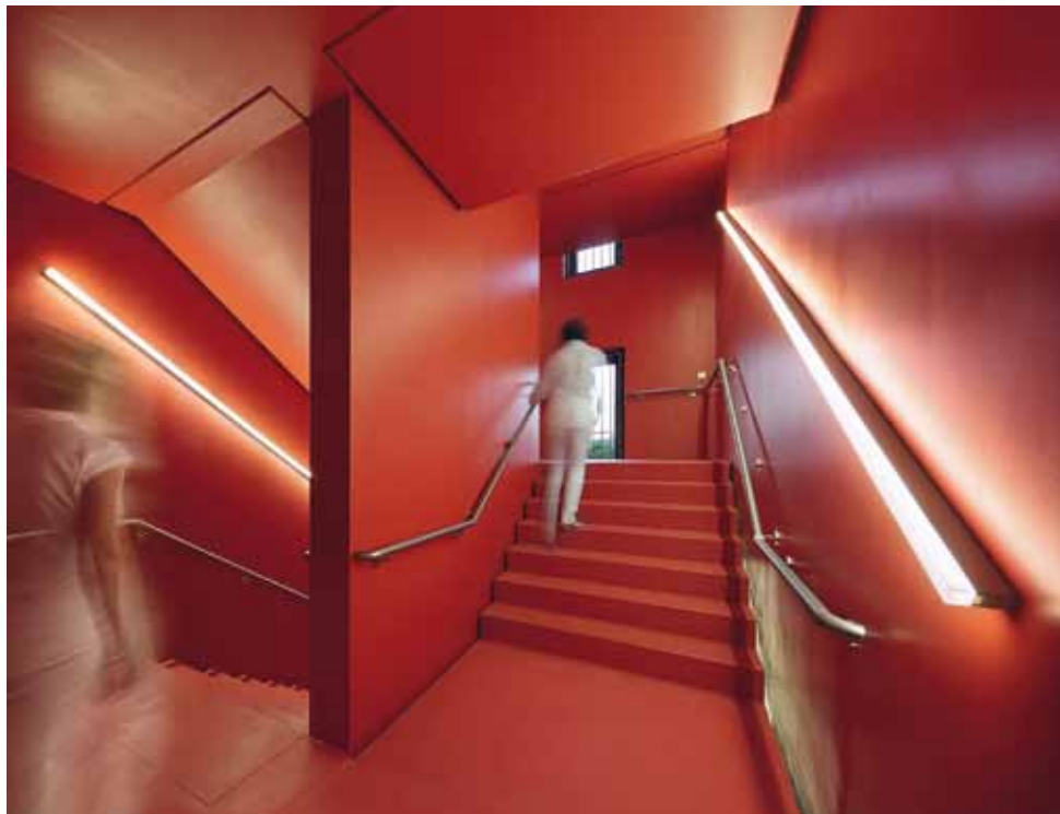
B3 | De trappenhuizen bieden een goede oriëntatie door de verschillende kleuren. Linaria lampen volgen het verloop van de trap en vormen als het ware een verlicht tegenstuk tot de leuning.