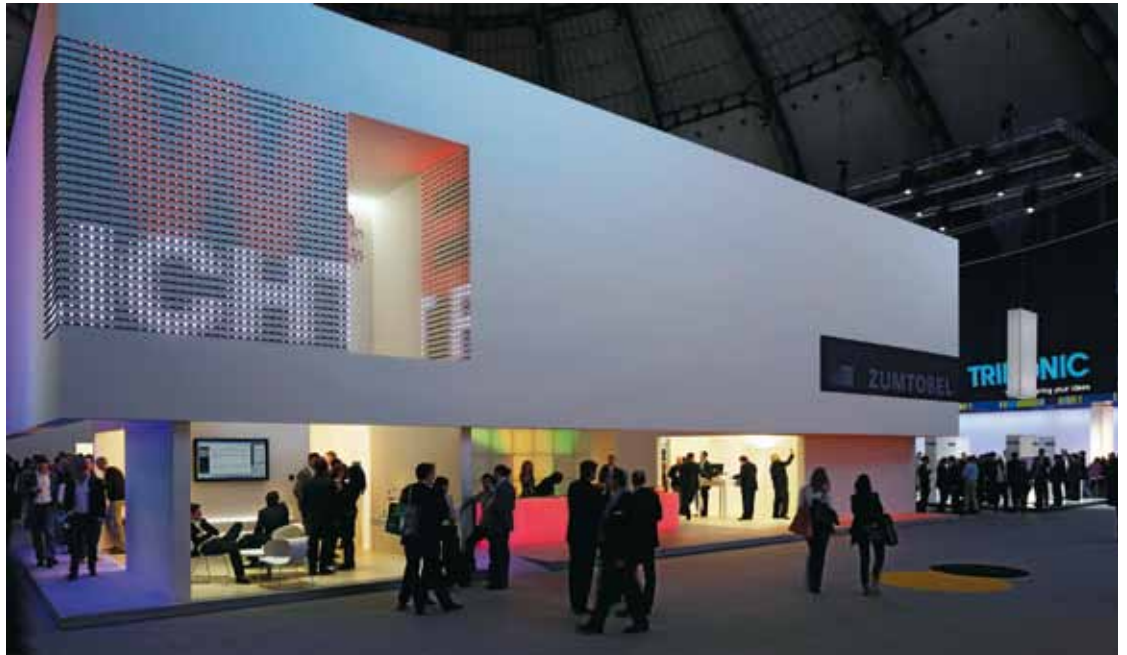
B2 | Die LED-Kette Capix verzaubert Fassaden in dynamisch leuchtende Objekte.