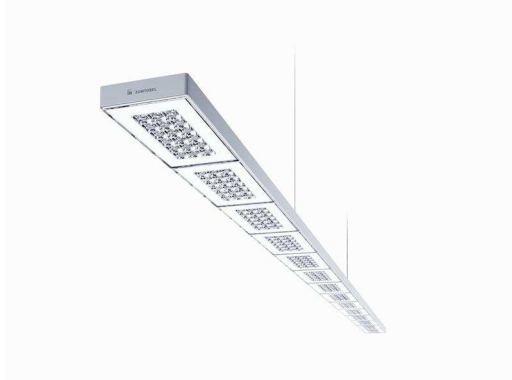
Foto 1: SEQUENCE fornisce un'equilibrata combinazione di luce diretta/indiretta, con moduli che si regolano individualmente.