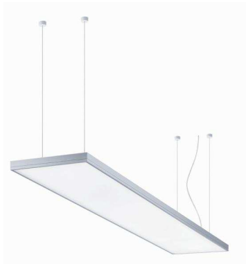
Foto 2: LIGHT FIELDS evolution in tecnologia TunableWhite è la risposta di Zumtobel all'esigenza di personalizzare la luce adattandola alle proprie necessità individuali.

Foto 1: SEQUENCE fornisce un'equilibrata combinazione di luce diretta/indiretta, con moduli che si regolano individualmente.