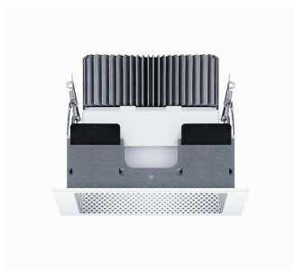
Foto 3: Luce di qualità eccellente, materiali di pregio e tecnologie innovative sono le caratteristiche che fanno di PANOS uno dei programmi di downlights LED più efficienti e più completi di tutto il mercato.

Foto 2: LIGHT FIELDS evolution in tecnologia TunableWhite è la risposta di Zumtobel all'esigenza di personalizzare la luce adattandola alle proprie necessità individuali.