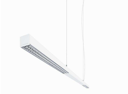
Foto 4: AXON è uno slanciato apparecchio da 38 x 38 mm ideato per le moderne architetture degli uffici.