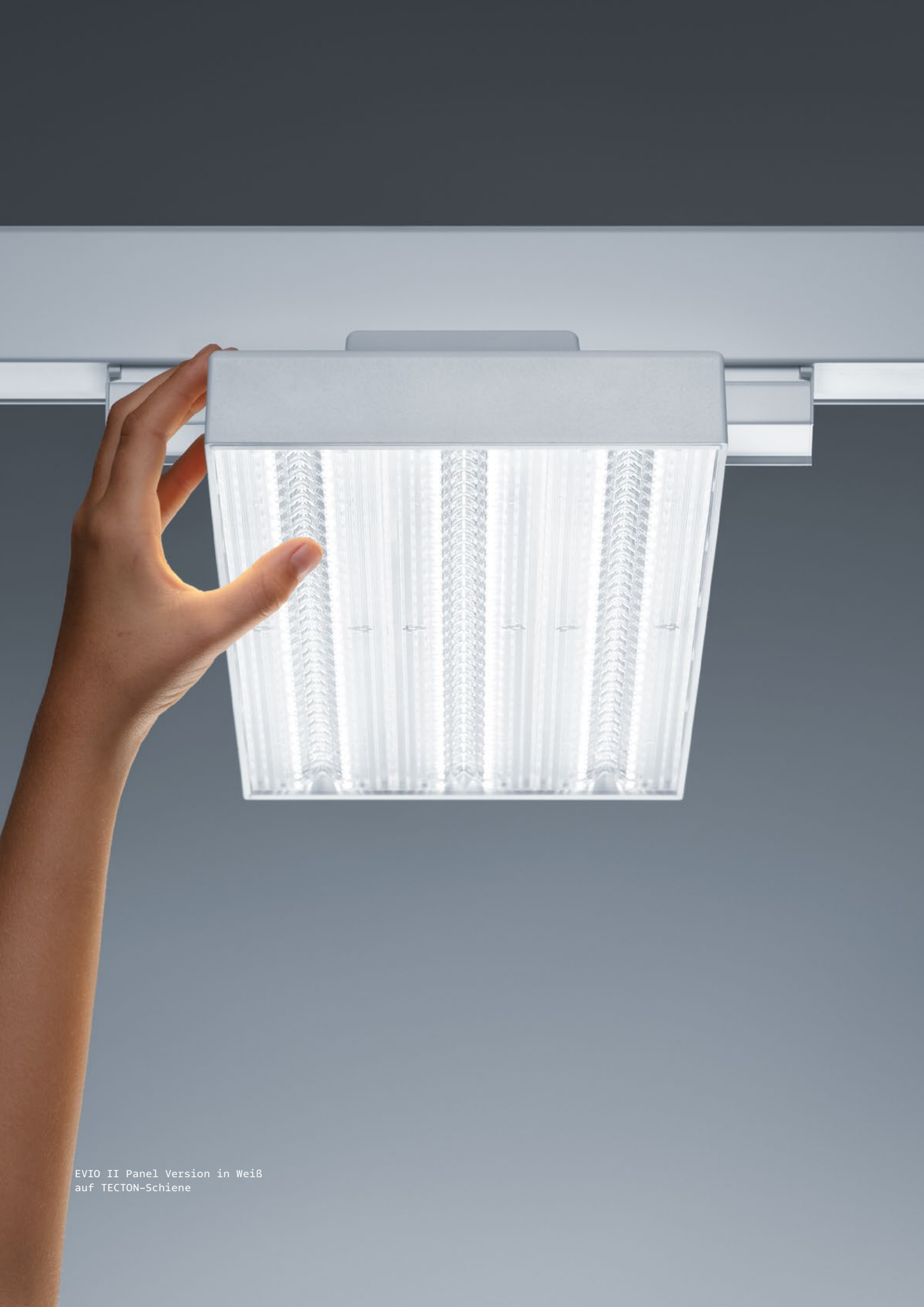
EVIO II Panel Version in Weiß auf TECTON-Schiene