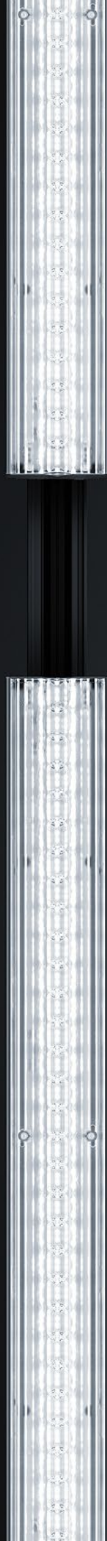
EVIO II Linear Version in Schwarz auf 3-Phasen-Stromschiene