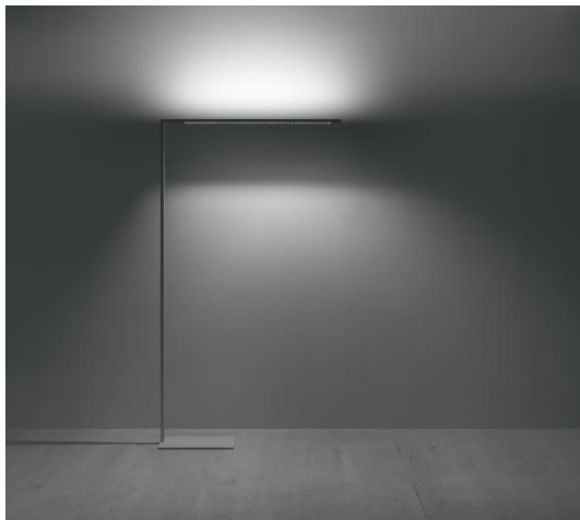
Image 2 : Le luminaire permet de commander individuellement l'éclairage directe et indirect du poste de travail.

Image 1 : LINETIK remet toutes les principes classique de l'éclairage de bureau en question – mais s'intègre parfaitement dans chaque environnement de bureau.