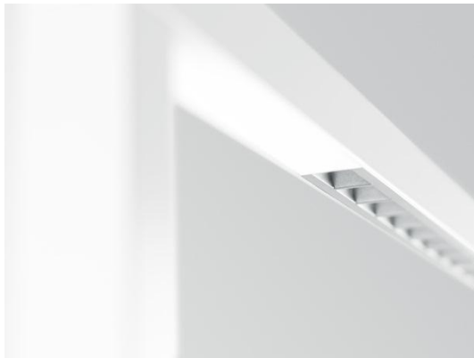
Foto 4: De nieuw ontwikkelde reflector maakt een compromisloze verblindingsbescherming en een precieze lichtverdeling mogelijk.