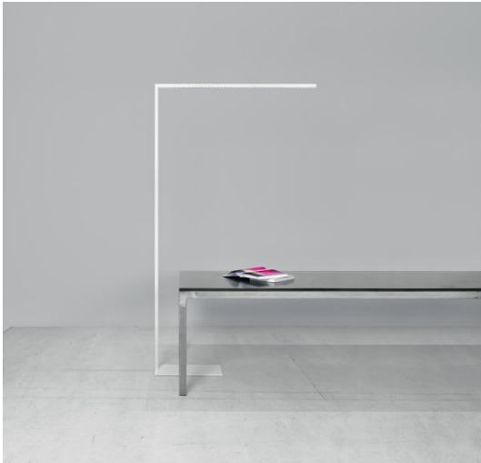
Foto 1: LINETIK stelt alle klassieke principes van de kantoorverlichting in vraag – maar integreert zich wel perfect in elk kantoorlandschap.