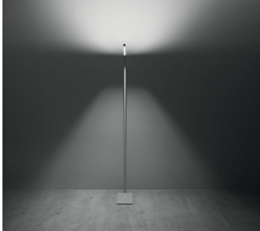
Foto 3: De direct-lichtreflector overtuigt door de buitengewoon gelijkmatige verlichting van het werkvlak, zelfs aan dubbele werkplekken.