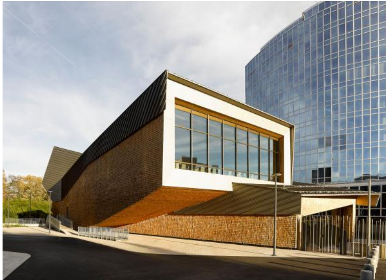
Bild 1: Der neue Konferenzsaal der Weltorganisation für geistiges Eigentum (WIPO).