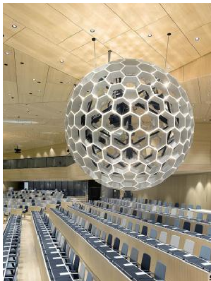
Bild 4: Die diffuse Lichtwirkung der Kugeln wird mit jeweils 540 Zumtobel LED-Lichtpunkten an den Kreuzungspunkten zwischen den einzelnen Waben erreicht.