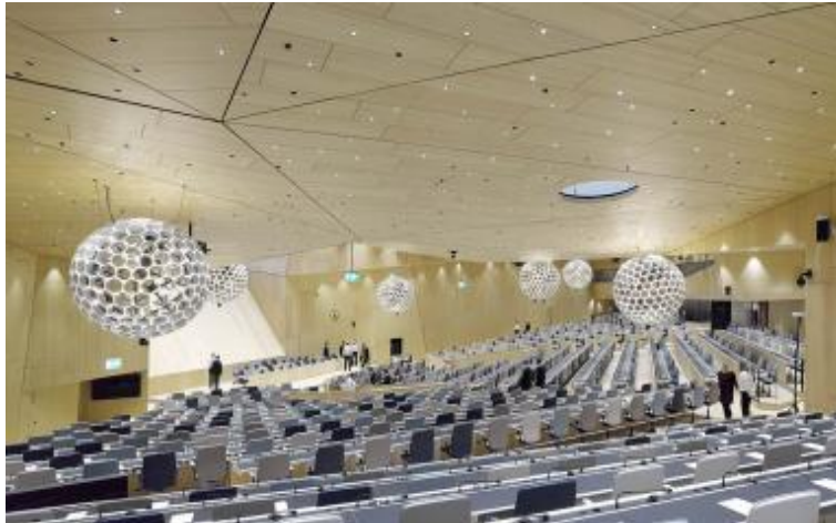
Bild 3: Leichte, „wolkig“ anmutende Kugelleuchten brechen die relativ strenge Dreiecksgeometrie der Holzdecke.