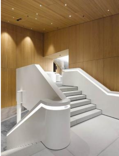
Foto 5: Ook andere lichtoplossingen van Zumtobel zijn op fijnzinnige wijze in de architectuur geïntegreerd en geven aan het gebouw een uniek eigen aura.