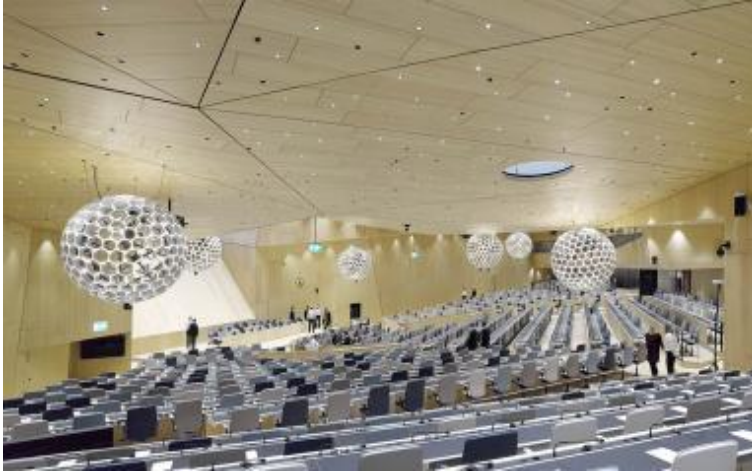
Foto 3: Lichte, haast zwevende lichtbollen doorbreken de relatief strenge driehoeksgeometrie van het houten plafond.