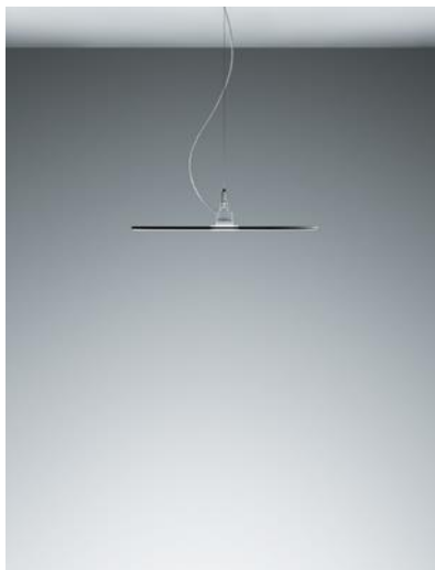
Image 2 : le luminaire suspendu s'enorgueillit de la technologie Side-lit : la lumière des sources lumineuses LED est diffusée dans les platines de guidage optique transparentes et répartie harmonieusement du centre vers le bord.

Image 1 : allumé, VAERO apparaît comme un disque lumineux ultraplat qui semble flotter dans l'espace. Éteint, il n'en est pas moins élégant.