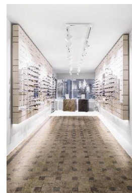
Bild 9, 10 + 11: Die gekachelten Fliesen des klar ausgeleuchteten Flagshipstores in Lausanne , Schweiz, finden sich im stringenten Kacheldesign der Präsentationsfläche wieder.