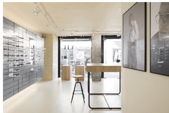
Bild 3 + 4: Moderner Industriecharme. Der Flagshipstore in Graz , Österreich, greift die dunkle Fassade mit edlen Grautönen im Interieur auf.