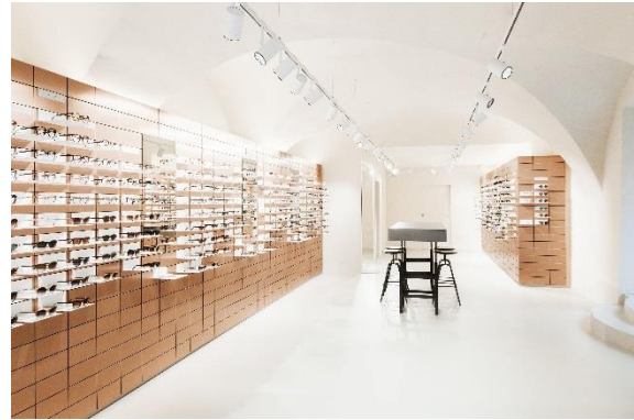
Bild 5 + 6: Der Flagshipstore in Salzburg , Österreich, wirkt hell und großzügig dank der zusätzlichen Voutenbeleuchtung mit ARROWFLEX von Thorn.