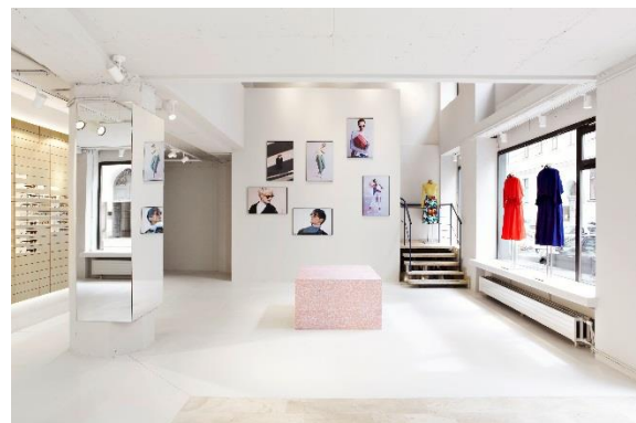
Bild 7 + 8: Klare Linien und angenehm helles Licht verleihen dem Flagshipstore in Wien , Österreich einen modernen und freundlichen Charakter.