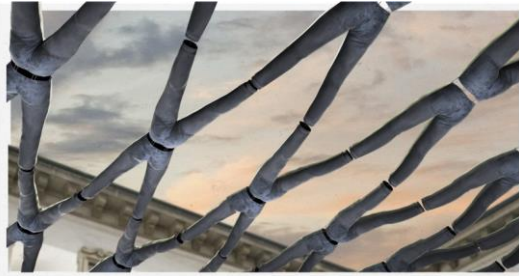
Foto 1: L'installazione dello studio Diller Scofidio + Renfro (DS+R) è una sorta di grata di 300 paia di jeans che ricopre come una rete l'intero cortile interno di Palazzo Litta. Per valorizzare l'opera nel modo più suggestivo, Zumtobel ha installato i proiettori PYLAS da esterni, che la illuminano dal basso con colori che si alternano.