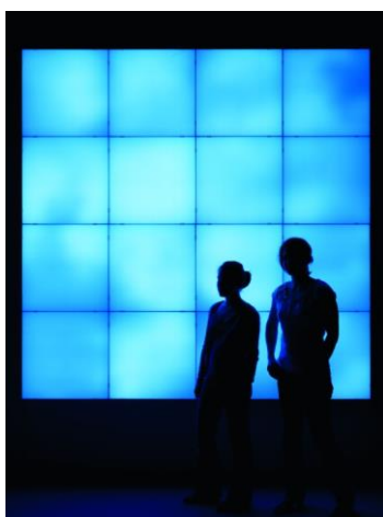
Foto 3: A creare un'atmosfera suggestiva provvedono i moduli CIELOS di Zumtobel, distribuiti nello showroom Sawaya & Moroni in modo da alternare i giochi di luce.

Foto 2: Il capolavoro di Zumtobel "VORTEX" by Zaha Hadid" è uno dei colpi d'occhio nell'illuminazione dello showroom Sawaya & Moroni.