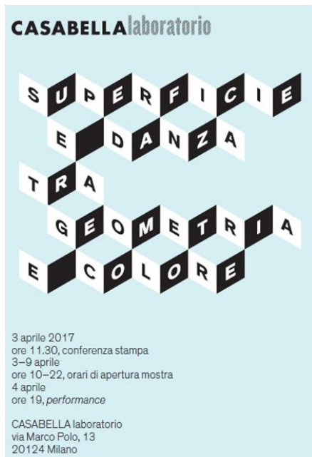
Foto 4: In occasione del Salone del Mobile, la galleria Casabella Laboratorio presenta l'evento "Superficie e danza tra geometria e colore". Zumtobel incornicia la mostra con un'artistica installazione di luce.