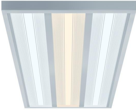
Illustration 4 : COESA est le premier luminaire de contrôle qualité de Zumtobel. Grâce à un éclairage de surface optimal, il détecte les défauts et les irrégularités même les plus infimes.