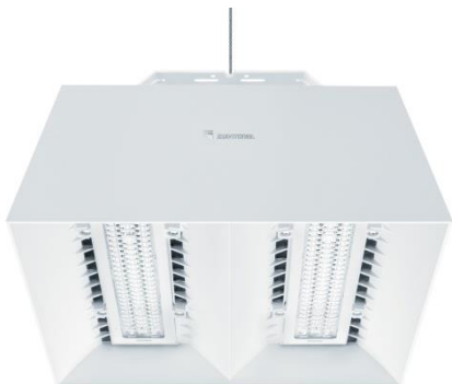
Illustration 2 : CRAFT Balanced White. Efficace, le luminaire de hall reçoit désormais également la technologie Balanced White. Le réglage de l'intensité lumineuse et de la couleur de la lumière favorise les performances et le bien-être des employés.

Illustration 1 : TECTON Balanced White. Grâce à la technologie Balanced White, la température de couleur est ajustable afin de rehausser significativement la qualité de la perception.