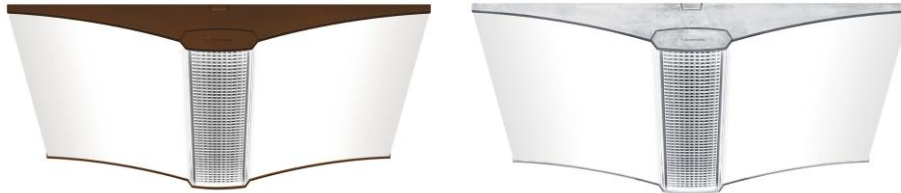
Bild 3 + 4: Die Leuchten MILDES LICHT, VAERO, ONDARIA und LIGHT FIELDS sind nun auch in den Farben Weiß, Schwarz, Silber, Bronze und Raw erhältlich.

Bild 1 + 2: Mit Leuchten in unterschiedlichen Design-Farben setzt Zumtobel neue Akzente in seinem Office-Portfolio und gibt Lichtplanern zukünftig noch mehr Gestaltungsspielraum.