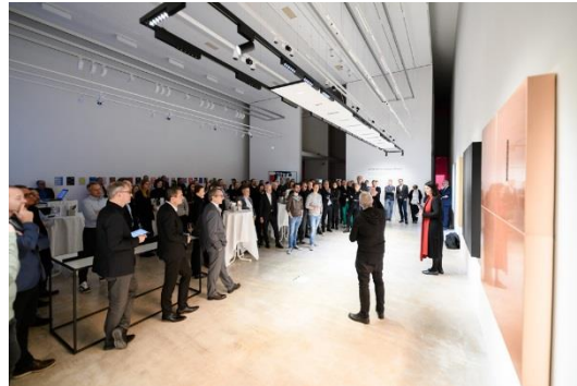
Bild 3: Anlässlich der Vorstellung der SUPERSYSTEM integral collection lud Zumtobel an einem zweiten Abend auch ins Zumtobel Lichtforum Dornbirn.