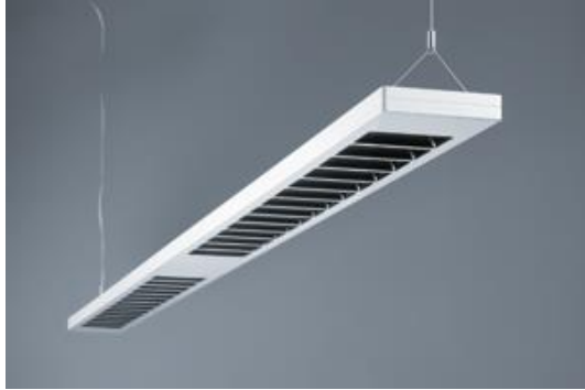
Photo 2 : La technologie LED éprouvée alliée à la structure micropismes MPO+ offre un confort visuel particulièrement élevé.