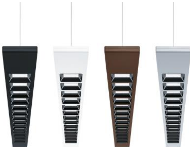
Photo 4 : L'interprétation moderne luminaire à grille est disponible en noir, blanc, bronze et argenté.