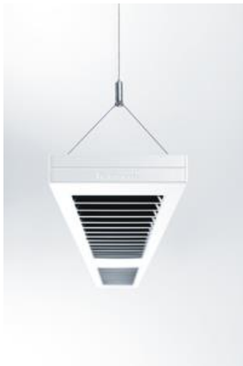
Photo 1 : La gamme CLARIS evolution avec son design éprouvé et une qualité de lumière incomparable. Un design à la géométrie linéaire qui s'adapte discrètement à toutes les architectures de bureau – en particulier grâce à ses 24 nouvelles combinaisons de couleurs.