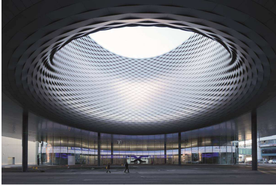
Foto 2: De imposante lichttuin binnen in het nieuwe beursgebouw is een extra architectonisch hoogtepunt dat veel bezoekers aantrekt.