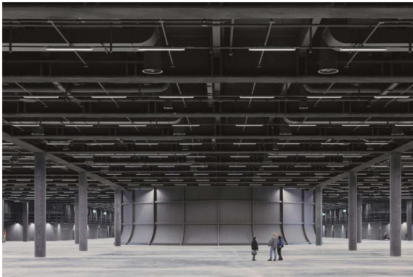
Foto 3: Optimale verlichting voor exposanten: de beurshallen werden door Zumtobel met het efficiënte lichtlijnsysteem Tecton uitgerust.