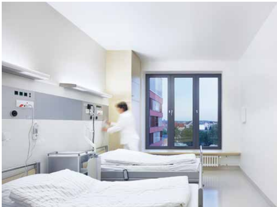
B6 | L'unità di alimentazione Conboard integrata nei mobili garantisce l'alimentazione degli impianti medicali.