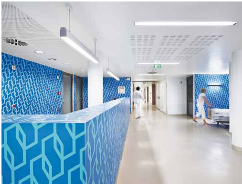
B5 | Uno speciale sistema di indicazioni con motivi e colori attraenti completa l'allestimento e aiuta i pazienti e i collaboratori a ritrovare i percorsi all'interno della struttura.