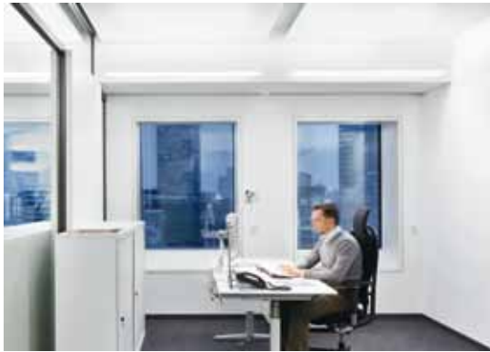
B2 | Le bâtiment, récompensé par la certification LEED platine et par la certification or de la Deutsche Gesellschaft für Nachhaltiges Bauen (DGNB), offre un espace de travail agréable à près de 3000 employés.