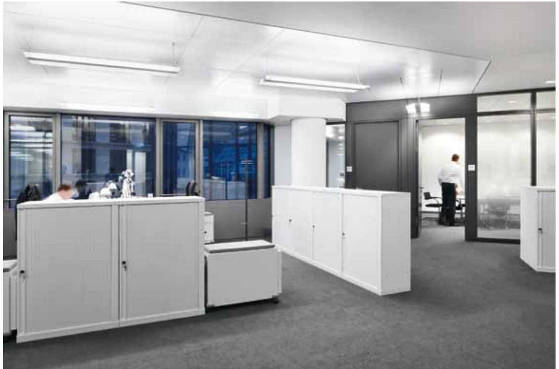
B7 | La variante suspendue du « luminaire-épée » éclaire, entre autres, les postes de travail au rez-de-chaussée.

Des solutions d'éclairage exceptionnelles ont été utilisées lors de la rénovation de la centrale bancaire. Cela s'applique également aux salles de réunion de l'espace dédié à la Direction. Des voiles de plafond formellement adaptés aux tables de conférence et à la géométrie des pièces affirment un caractère propre, grâce aux canaux de lumière à LED Slotlight II intégrés dans le chaos organisé. Pour cela, les raccords sans joints au niveau des intersections ont été un défi. Les LED de 1,2 W d'une température de couleur de 3 000 K et à large angle de diffusion créent une apparence homogène, en association