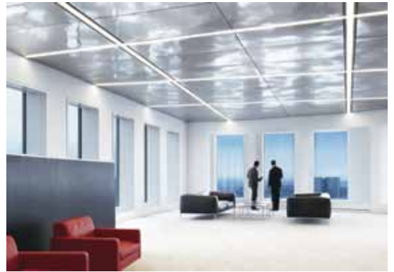
B3 | Lors de la rénovation de la Deutsche Bank, la lumière a été un outil architectural essentiel. Dans ce contexte, cela dépend avant tout du mélange idéal de lumière naturelle et de lumière artificielle.

ni. Des sols en pierre naturelle, du fer ciré noir pour l'aménagement des décors intérieurs, des enduits stuqués à la chaux pour les surfaces murales ou du verre satiné rétro-éclairé par des LED sont synonymes de sincérité et de durabilité.