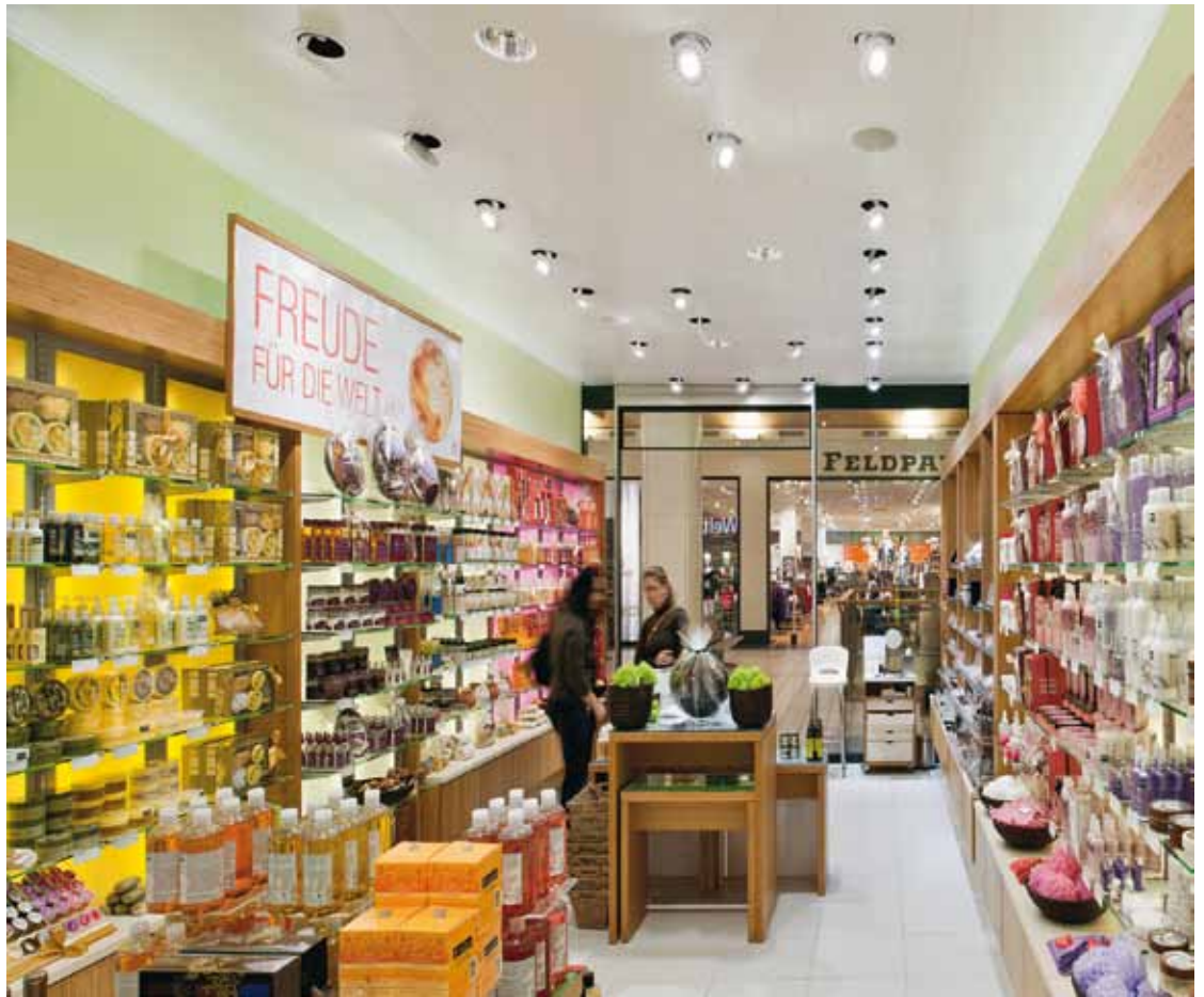
B3 | Le downlight à LED Panos Infinity et le projecteur à LED Discus comptent parmi les luminaires à LED les plus modernes du portefeuille de produits Zumtobel. Leur qualité de lumière et leur efficacité créent de nouvelles références.