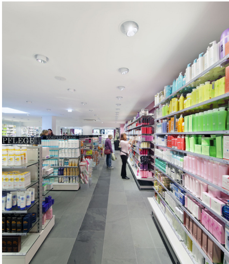
B2a + B2b | Zumtobel bootst aan haar stand lichtoplossingen voor alle verkoopruimtes realiteitsgetrouw na - van boetiek tot supermarkt tonen.