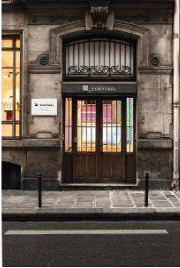
Foto 2: Het puristische Zumtobel design is daarbij onmiskenbaar aanwezig en versterkt nog het charisma van het historische gebouw.