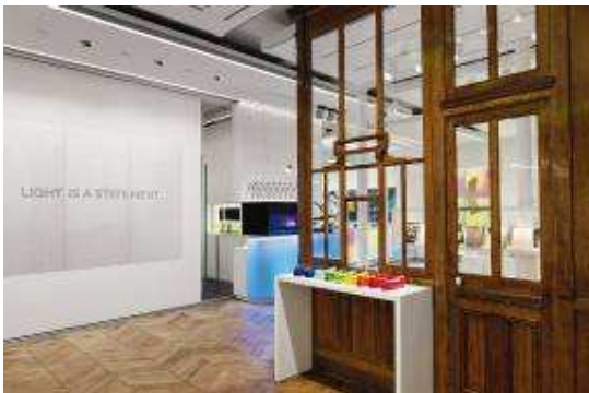
Foto 3: Het hele gamma van mogelijkheden om producten en objecten met licht te ensceneren wordt hier op een authentieke en indrukwekkende wijze aan de bezoeker getoond.