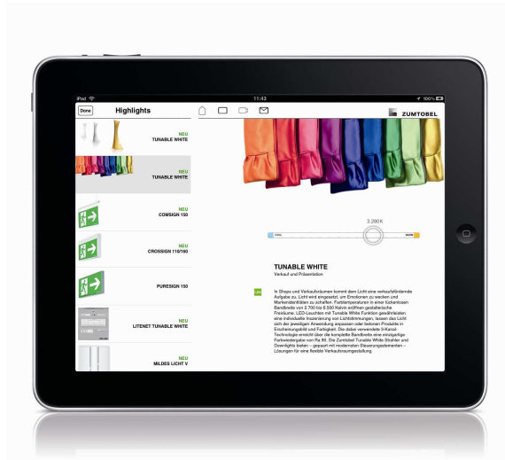
Foto 1: Vanaf nu is een nieuwe, uitgebreide versie van de Zumtobel "Map of Light" in de App Store verkrijgbaar.