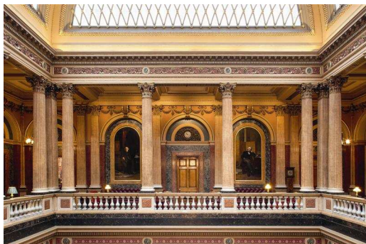
Photo 3 : La solution d'éclairage respectueuse de l'environnement est idéalement incarnée par l'interaction entre la technologie LED actuelle et les luminaires innovants dotés d'un système de gestion intelligent ; le Luxmate Litenet de Zumtobel réunit des propriétés complexes (utilisation de la lumière du jour, détection électronique de présence, intégration de l'éclairage de sécurité, profils prédéfinis des espaces) et une unité centrale facile d'utilisation.

Photo 2 : La source lumineuse devant rester quasiment indétectable, on a donc dans tous les espaces, au rez-de-chaussée comme au premier étage, posé le Supersystem dont les luminaires à LED sont très discrets.