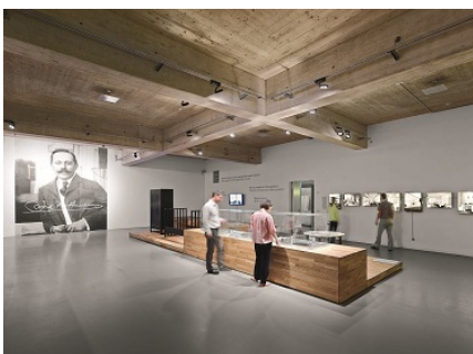
Bild 4: L'utilisation de bois - qui fixe le CO 2 - comme matériau principal a non seulement un effet positif sur le bilan carbone, mais crée également une ambiance chaleureuse qui invite à découvrir et à prendre son temps.