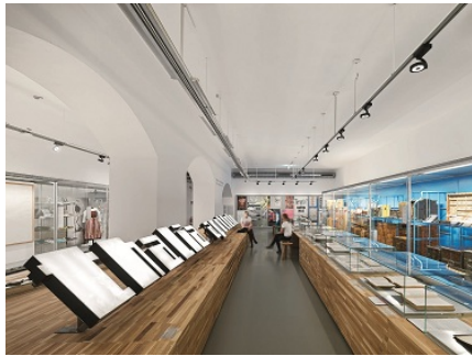
Foto 1: Het nieuwe concept van het MAK Designlaboratorium toont design als centrale kracht voor meer levenskwaliteit.