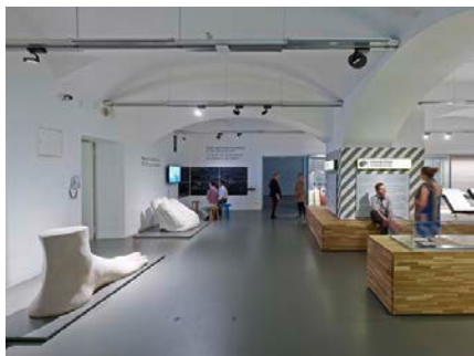
Foto 2: Over een oppervlakte van 2.000 m 2 zetten vandaag ongeveer 300 DISCUS evolution LED-spots (in plaats van 100 weinig efficiënte halogeenspots) ca. 2.000 expositiestukken individueel in scène.