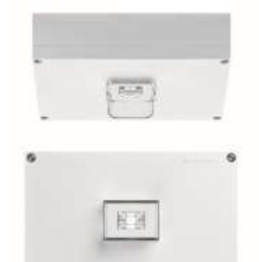
Foto 1: De veiligheidsarmatuur ONLITE RESCLITE high ceiling (HC) van Zumtobel is een krachtige oplossing voor hoge plafonds, zoals deze meestal voorkomen in de industrie en in magazijnen en winkelcentra. RESCLITE HC escape kan tot een plafondhoogte van 23 m geïnstalleerd worden.