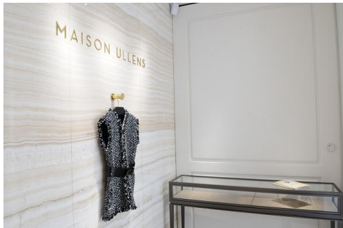
Foto 1: Zumtobel ontwikkelde voor het label Maison Ullens in Parijs een LED-lichtconcept op maat.