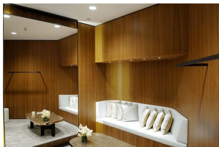
Foto 5: De pasruimtes zijn geconcipeerd als coconachtige retreats die voor een warme, vertrouwelijke winkelervaring zorgen. Hier zijn PANOS infinity downlights en het lichtstelsel MICROTOOLS geïnstalleerd.