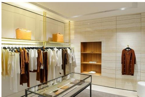
Foto 3: De lichtoplossing ondersteunt het winkelconcept vooral door het lichteffect terwijl de armaturen zelf helemaal niet op de voorgrond treden.