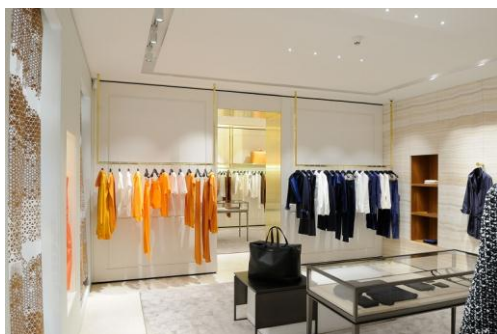
Foto 2: De LED-spot VIVO XS overtuigt door de hoge kleurweergave, schitterend licht en een minimalistische vorm.